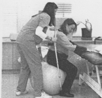
Una mujer realiza ejercicios ayudada por una enfermera

La Fundación contra la Esclerosis Múltiple Eugenia Epalza ha recibido los más de 6.000 euros procedentes de la recaudación de la II Kosta Trail, una marcha de montaña que reunió a más de setecientos participantes. el pasado mes de junio. Esta suma se destinará a financiar los servicios de rehabilitación que se ofrecen en el centro ubicado en el bilbaíno barrio de Ibarrekolanda. Gorka Ansuategui, de Seguros Lagun Aro y Jesús Beamonte, de Forum Sport, hicieron entrega de la cantidad a la presidenta de la entidad, Begoña Rueda.