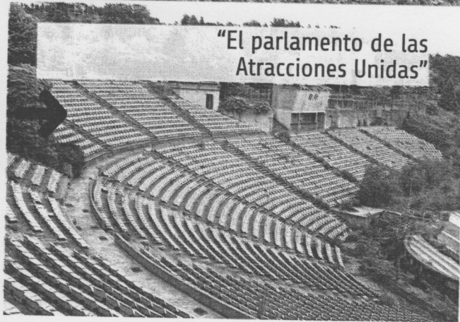
"El parlamento de las Atracciones Unidas"

La idea es mostrar el parque tal y como está, desmantelado, en desuso. «Las atracciones desaparecidas y el lugar conquistado por el tiempo, la herrumbre y el moho han dado paso a nuevos lugares de atracción. No hace falta retocar el parque ni limpiarle la cara para descubrir un lugar que simboliza la exuberancia de un Bilbao pletórico en los setenta y un Bilbao de sueños rotos en los ochenta en plena crisis. La antesala del cambio de una ciudad industrial a una ciudad de servicios», cuenta la artista. Así, la idea es mostrar un lugar que lleva cerrado 17 años a quién no lo conoció y, sobre todo, a toda esa gente que acudió en su infancia y adolescencia